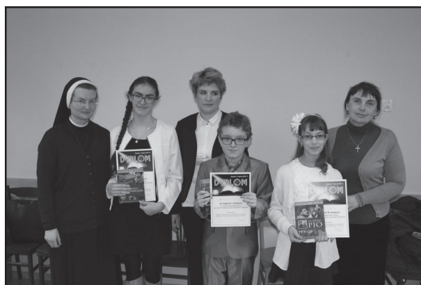
Laureaci z opiekunami