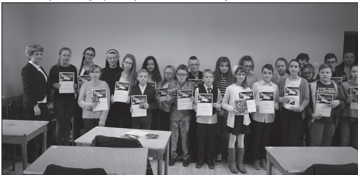
Wszyscy uczestnicy konkursu