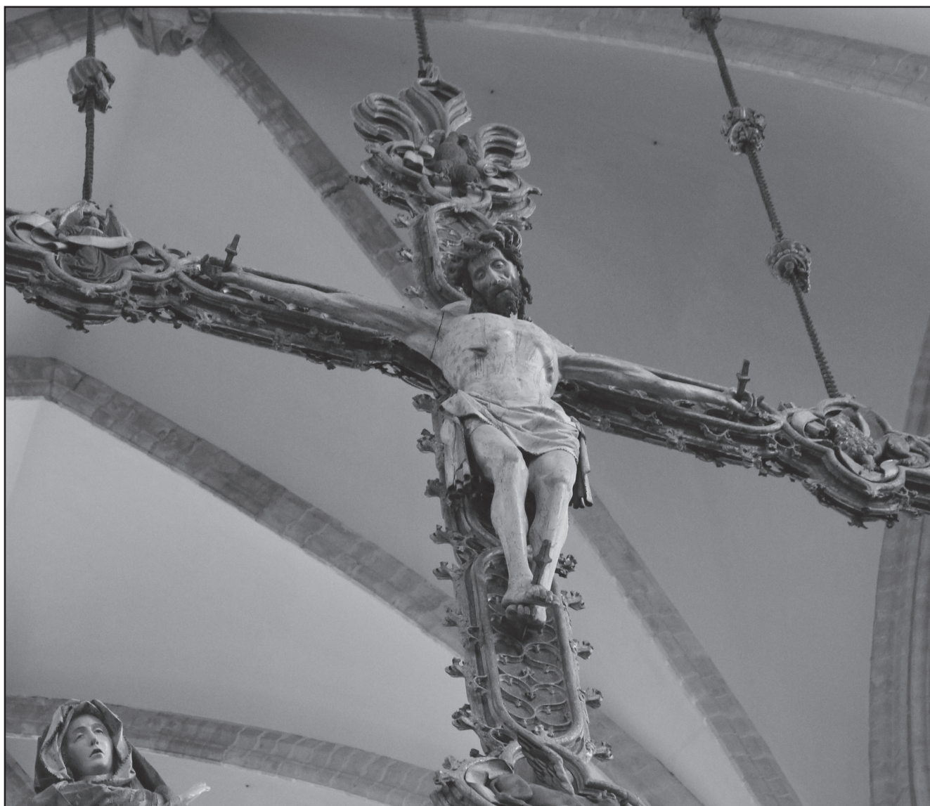
Ukrzyżowany na belce tęczowej kościoła Pieterskerk w Louvain, Belgia, XV w.