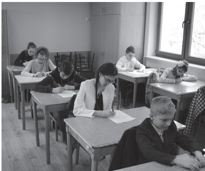
Ks. TG. skupienie w czasie pisania testu

Te trzy osoby zakwalifikowały się do finału diecezjalnego, który odbędzie się w Przemyślu dnia 16 maja br. Gratulujemy laureatom i uczestnikom konkursu bogatej wiedzy dotyczącej Pisma Świętego.