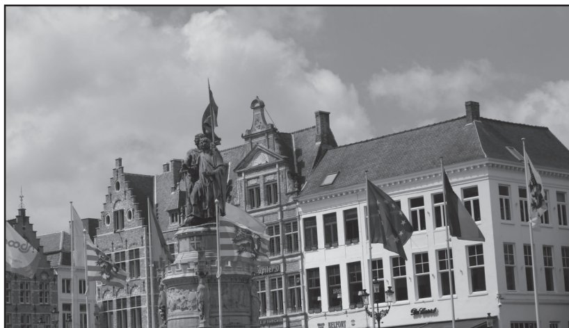
bohaterowie Flandrii na tle kamienic