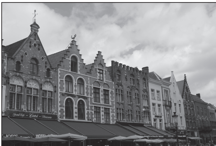
średniowieczne kamienice przy Markt (lub według malkontentów ich rekonstrukcje)