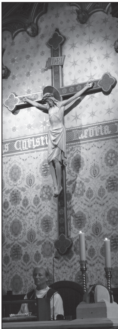
„kapłanka” strzegąca Relikwii