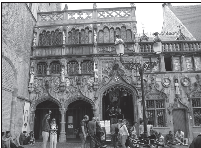
renesansowe ujęcie wejścia do Bazyliki Św. Krwi

at i od razu rzuca się w oczy wykwiwna renesansowa fasada Bazyliki Świętej Krwi (Heilig Bloed Basiliek), skrywająca w środku wiele starsze budowle. Swoją nazwę bierze od relikwii Krwi Chrystusa, która trafiła tu między 1150 a 1204 rokiem w nie do końca wyjaśnionych okolicznościach. Według tradycji fragment szaty z krwią Jezusa przywiózł z drugiej wyprawy krzyżowej hrabia Thierry Alzacki, który otrzymał ją od patriarchy Jerozolimy. Druga wersja podaje z kolei, że uczynił to hrabia Baldwin, po zdobyciu Konstantynopola w 1204 roku. Tak czy inaczej od setek lat relikwia ta przyciągała tysiące pielgrzymów do Brugii. Każdego roku w dniu Wniebowstąpienia przez miasto przechodzi uroczysta procesja ku czci relikwii, która mimo niewątpliwego zeświecczenia Belgii nadal gromadzi tysiące pielgrzymów i jest zapisana na listę światowego dziedzictwa UNESCO.