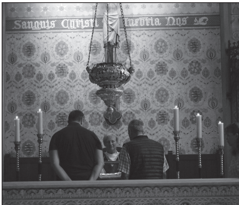
pielgrzymi (turyści) oglądają z bliska relikwie