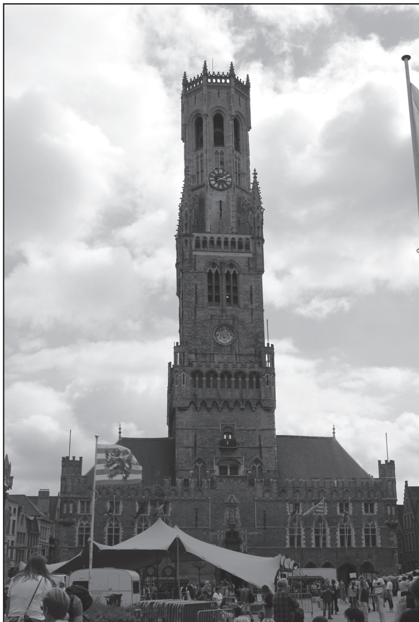
Belfort – wieża miejska wysokości 83 m.

Jeśli Markt był centrum handlowym, to Burg stanowił centrum administracyjne i religijne miasta. Do Burg dochodzi się z Markt ulicą Breidelstra-