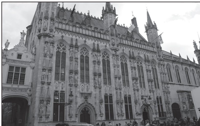
Ratusz (Stadhuis) przy placu Burg