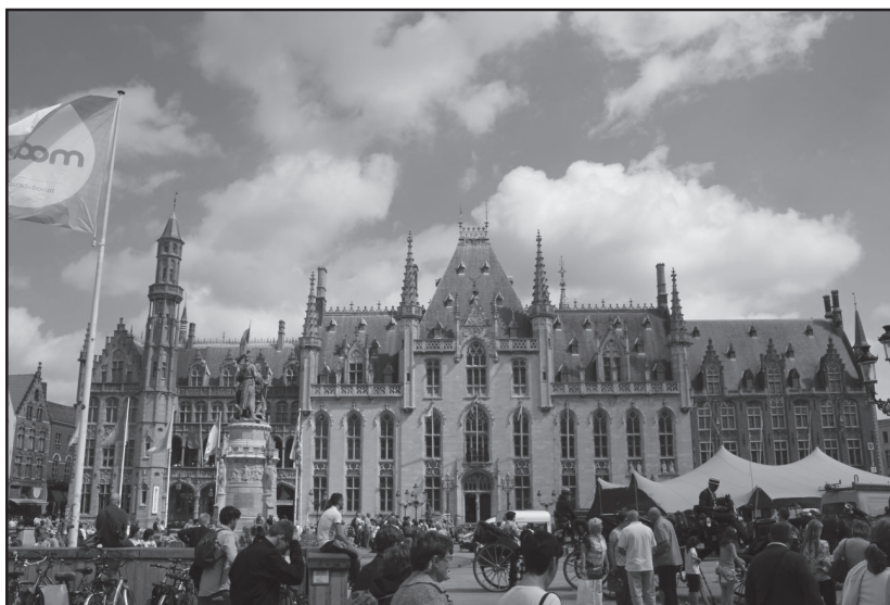
neogotycki budynek Sądu Prowincjonalnego