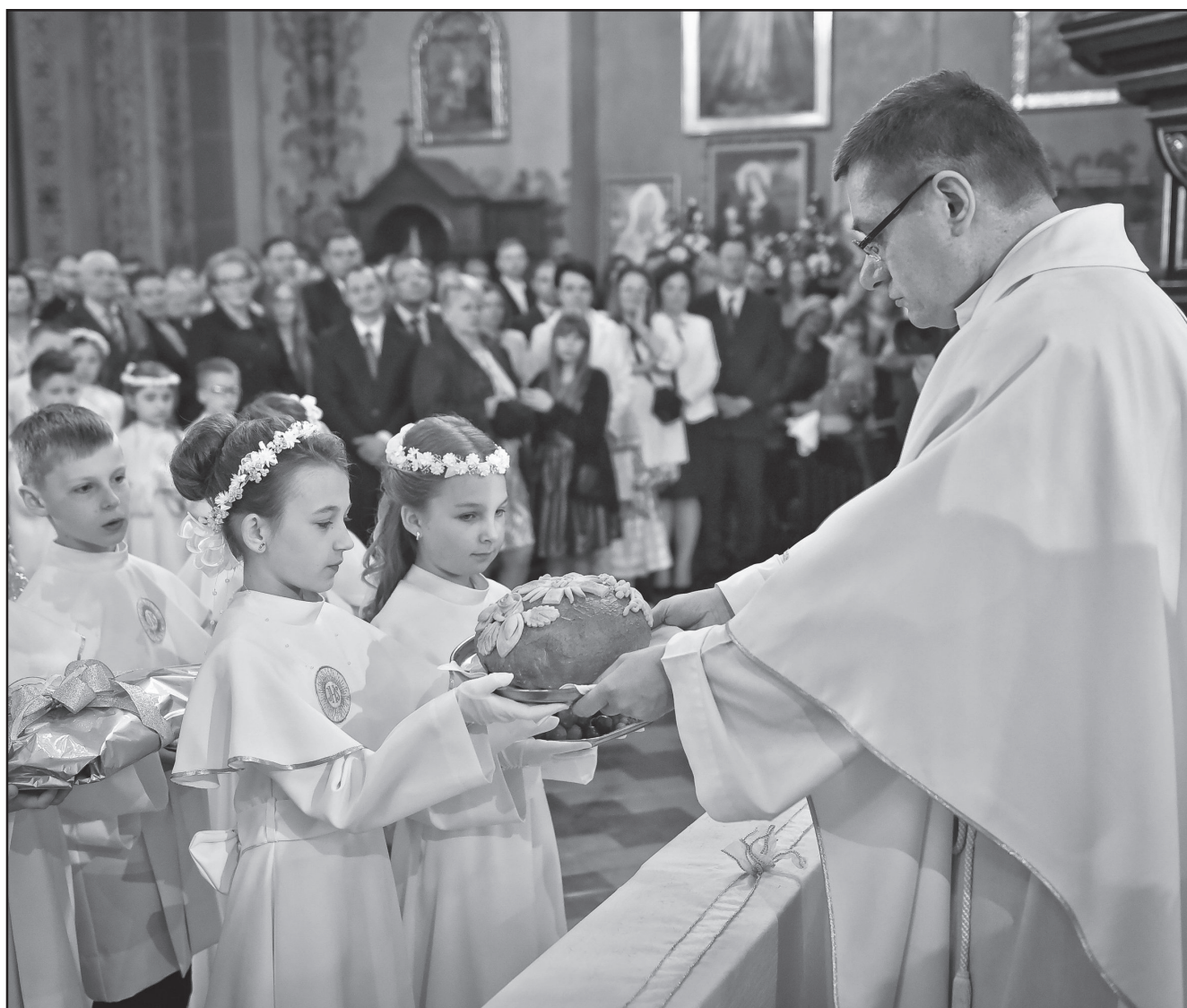
Ofiarowanie darów w dniu I Komunii św., fot. Krzysztof Malek

„Być bliżej Ciebie chcę” dzień pierwszej Komunii św.