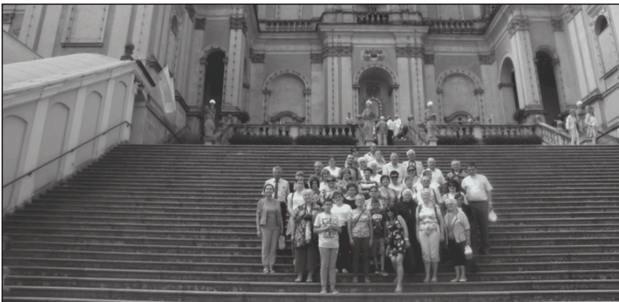
Pielgrzymi na schodach bazyliki.

Teresa Stareńczak