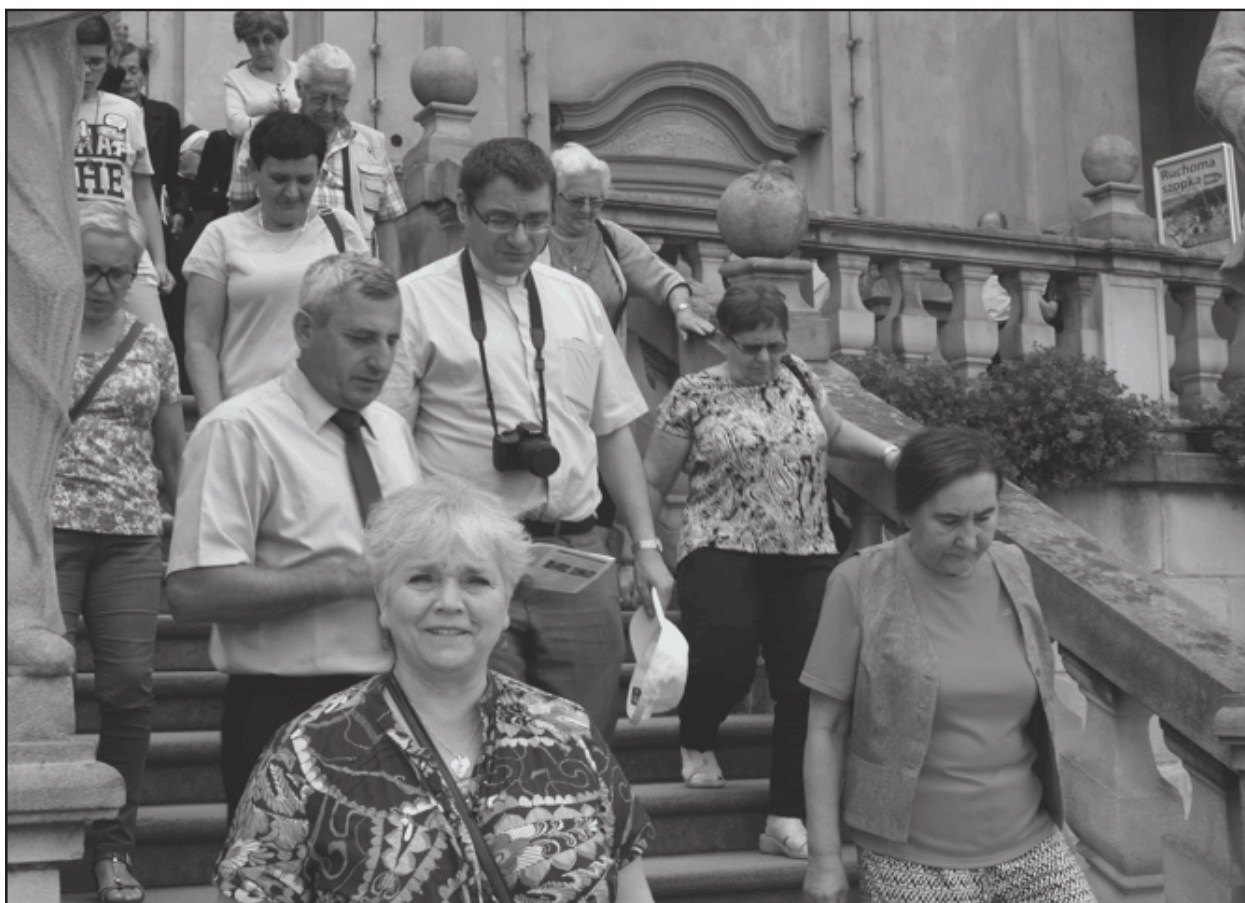
Po zwiedzeniu, opuszczamy bazylikę.