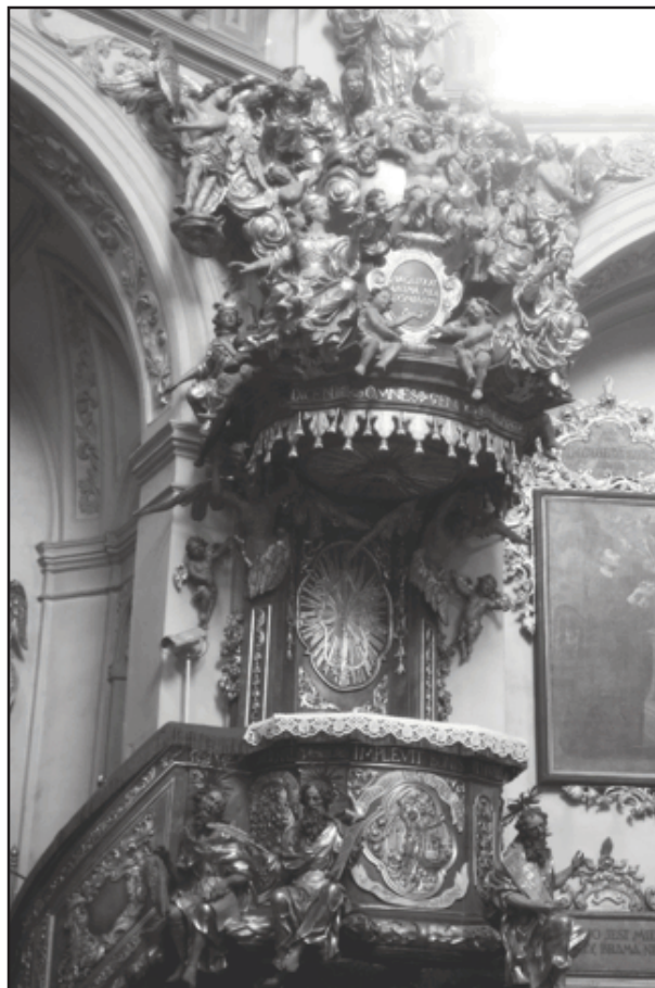
Ambona w bazylice.