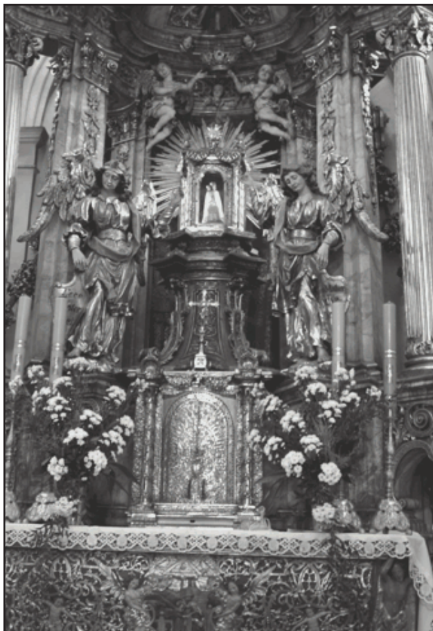
Główny ołtarz z cudowną figurką Matki Bożej.